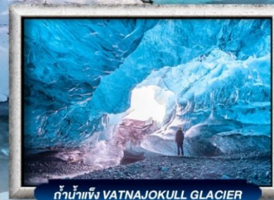
ถ้ำน้ำแข็ง VATNAJOKULL GLACIER

บินธุรกิจการบิน Full Service | พิเศษ! ทานอาหารโดมกระจกิว 360 องศา