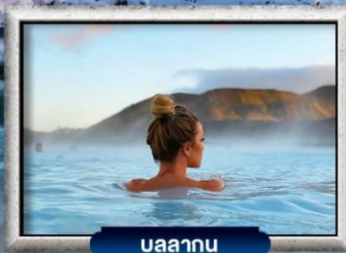
บลูลากูน